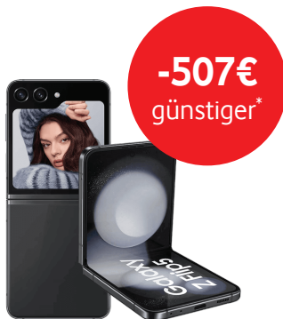
Galaxy Z Flip5 256GB 3