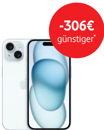
iPhone 15 128GB 3