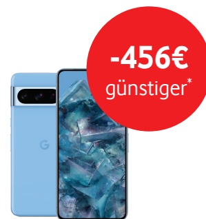
Pixel 8 Pro 128GB 3

* Ersparnis ggü. der UVP des Herstellers in Kombination mit GigaMobil M und Mitarbeiter-Rabatt, Stand 29.11.2023.