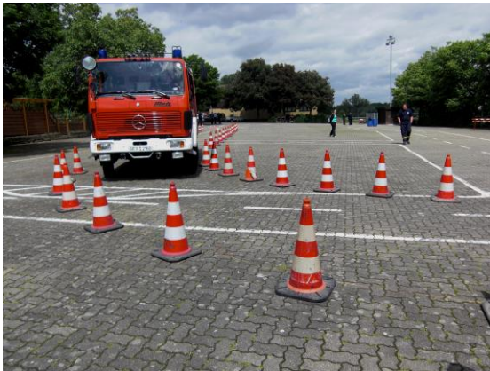
Einfahrt in die Spurkurve

Anhalten in der Spurgasse pro Halt = 25 Fehlerpunkte