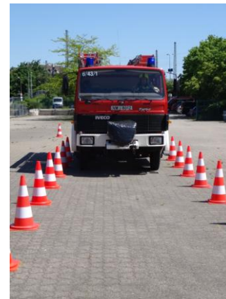
Befahren der Spurgasse

Anhalten in der Spurgasse pro Halt = 25 Fehlerpunkte