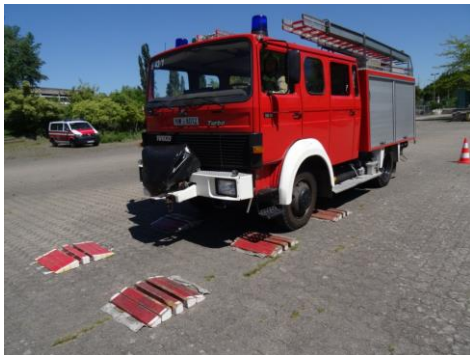
Fahrt über die Schlauchbrücken

Je verrutschte Schlauchbrücke = 25 Fehlerpunkte Anhalten zwischen den Schlauchbrücken = 25 Fehlerpunkte Zu schnelles Überfahren der Schlauchbrücken führt zur Disqualifikation