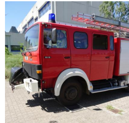
Korrektes Anhalten innerhalb der Markierung

Vor- oder hinter dem Rechteck angehalten = 100 Fehlerpunkte Mit dem rechten/linken Vorderrad außerhalb des Rechtecks angehalten = 50 Fehlerpunkte Mit dem rechten/linken Vorderrad auf der Markierungslinie angehalten = 25 Fehlerpunkte Vor dem Hindernis angehalten und korrigiert = 25 Fehlerpunkte