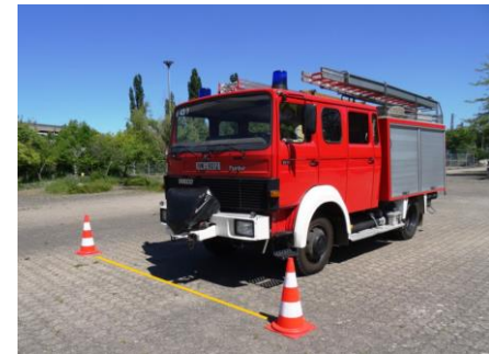
Start der Bewertungsfahrt