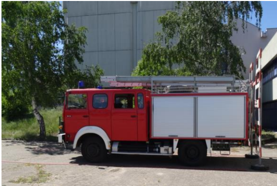
Einfahrt in die Spurgasse und Anhalten am Gatter

Anhalten in der Spurgasse wird hier nicht mehr bewertet!