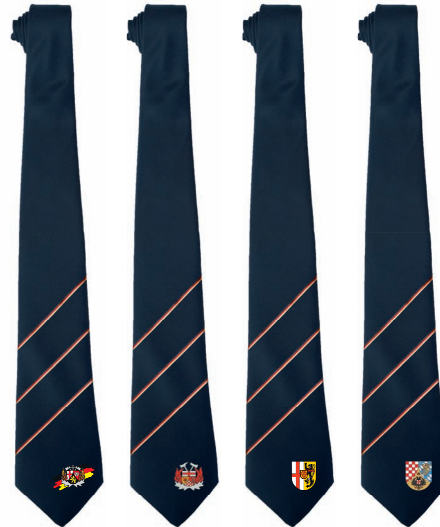
von links: Landesfeuerwehrverband, Kreisfeuerwehrverband, Landkreis, Stadt/VG