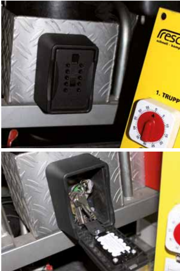
Abbildung 1 und 2 Schlüsselbehälter mit Zahlenschloss zwischen den Vordersitzen

tresor innerhalb der Feuerwehrrfahrzeuge, wobei der Schlrüsseltesor fest mit dem Fahrzeug verbunden werden muss. Der Zugang zum Tresor ist dann z. B. über einen Zahlencode möglich ist (siehe Abbildung 1 und 2).